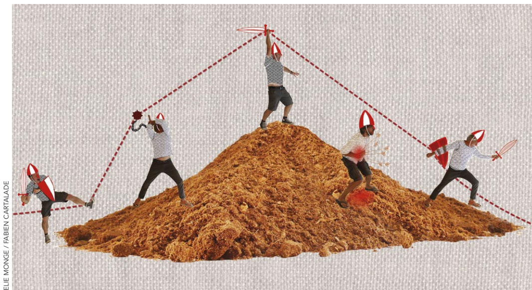
ELIE MONGE / FABIEN CARTALADE

de Yoann Pencilé | ms Yoann Pencilé | Bienvenu au Cirque minimal ! Venez découvrir des acrobaties spectaculaires, des animaux féroces, des personnages extravagants et même quelques bêtes de foire ! | 2 interprètes | CRÉATION ET TOURNÉE DEPUIS AOÛT 2019